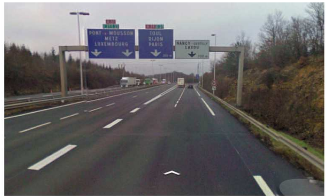
Sortie NANCY-GENTILLY LAXOU

Il faut ensuite suivre la direction NANCY-CENTRE, Jusqu'au panneau CENTRE MEDICAL GENTILLY sur votre gauche