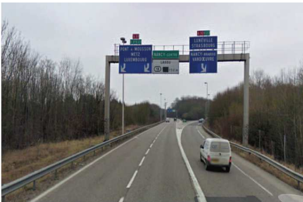
Sortie 18 NANCY-CENTRE LAXOU